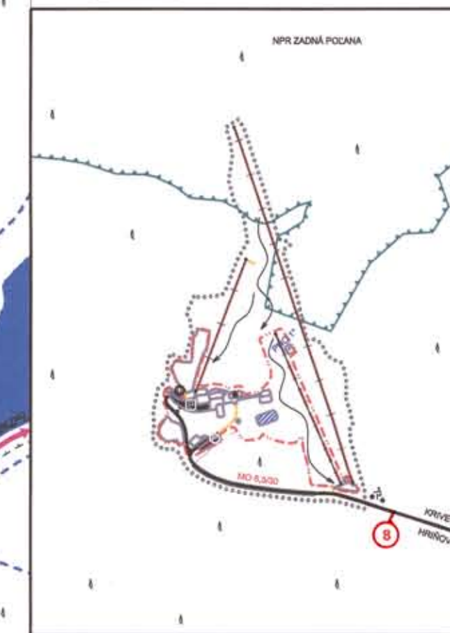
STREDISKO REKREÁCIE A TURIZMU POLANA